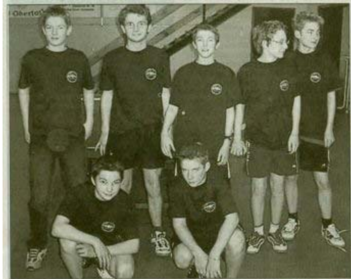
Goethe-Schüler beim Landesentscheid Dritter

Die Tischtennis-Schulmannschaft des Bensheimer Goethe-Gymnasiums (Jg. 1990 bis 1993) belegte als frisch gekürter Kreis- und Bezirksmeister beim Landesentscheid in Bad Soden-Salmünster den hervorragenden dritten Platz. Sie verpasste damit leider unglücklich das Bundesfinale bei "Jugend trainiert für Olympia".